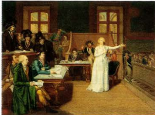
Le procès de Marie-Antoinette.

Au XVIII e siècle, ce commerçant protestant de Toulouse fut accusé sans preuve d'avoir assassiné son fils pour l'empêcher de se convertir au catholicisme. Le fils s'était, en fait, suicidé parce qu'il n'avait pas obtenu du clergé catholique l'autorisation d'exercer le métier de juriste. Jean Calas est condamné au supplice de la roue et exécuté. Voltaire réussit à prouver l'erreur judiciaire.